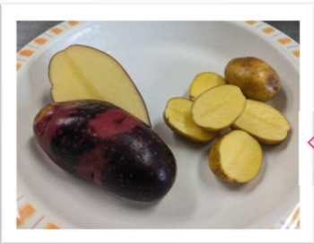
素材の味を生かした 「手作りポテトチップス」