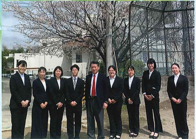
2025年度新規採用者の皆さんと

発行：聖ヨハネ学園後援会 〒569-1032 高槻市宮之川原2-9-1 TEL&FAX 072-687-0548