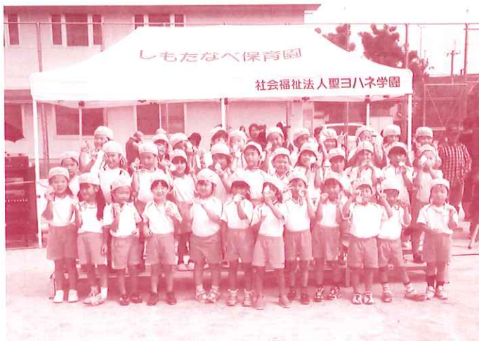
みんなで金メダルもらいました 下田部保育園・体育遊び

発行：聖ヨハネ学園後援会 〒569-1032 高槻市宮之川原2-9-1 TEL&FAX 072-687-0548