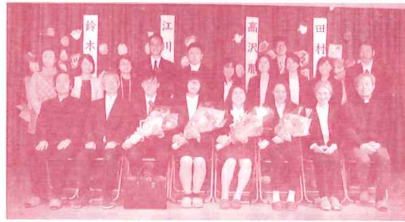
卒園式の記念写真