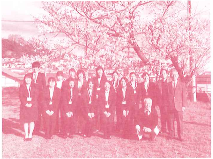
2020年度新規採用者のみなさんと満開の桜の前で

発行：聖ヨハネ学園後援会 〒569-1032 高槻市宮之川原2-9-1 TEL&FAX 072-687-0548