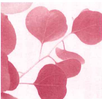
ユーカリ・ポポラスの葉